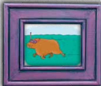
Ilustraciji: Nina Bric

Kje: Trubarjeva hiša literature, Stritarjeva 7